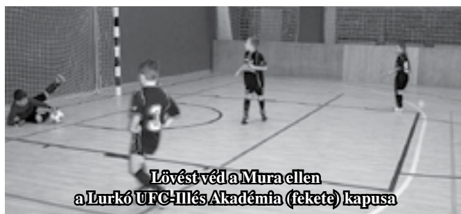
Lövést véd a Mura ellen a Lurkó UFC-III Akadémia (fekete) kapusa