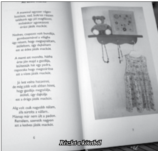
Részlet a kötetből