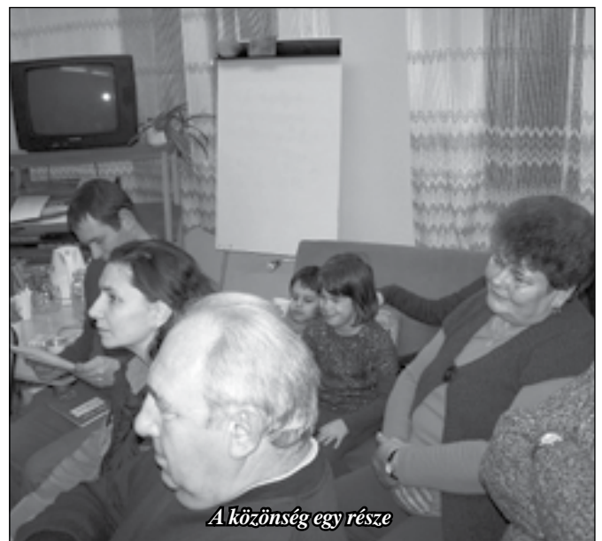
A közönség egy része