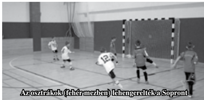
Az osztrákok (fehér mezben) lehengerelték a Sopront