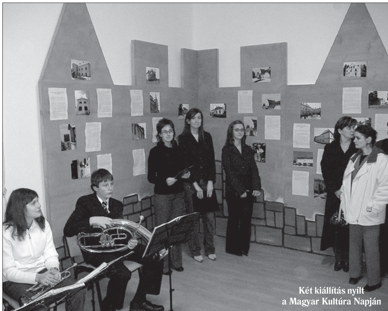
Két kiállítás nyílt a Magyar Kultúra Napján